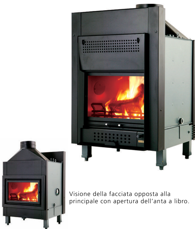
Visione della facciata opposta alla principale con apertura dell'anta a libro.

Con antina verticale a scomparsa e visione del fuoco da entrambi i lati